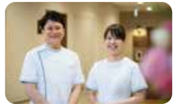
看護・介護スタッフが常駐