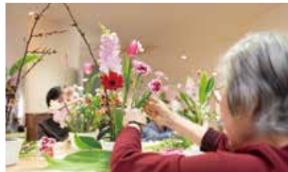
緑や花を通して認知症の 維持・改善を促す園芸療法