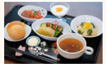
見た目を損なわず、食べやすい軟菜食