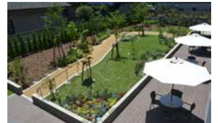
施設内の広大な庭園で 気軽にリフレッシュ