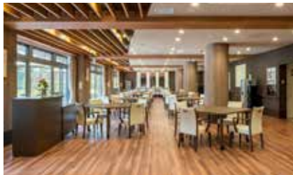
ご入居者さまが集う 明るく開放的なダイニング