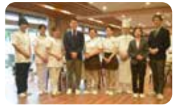
スタッフ全体でサポートします