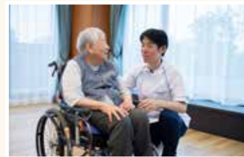
暮らしに活気が生まれます