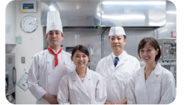
お食事の様々なご要望に応えます