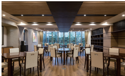
ご入居者さまが集う 明るく開放的なダイニング