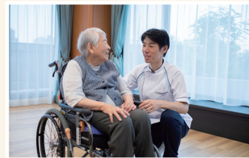
暮らしに活気が生まれます