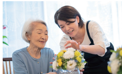
ご入居者さまのご要望に 応えるレクリエーション