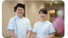
看護スタッフが24時間常駐