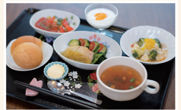
見た目を損なわず、食べやすい軟菜食