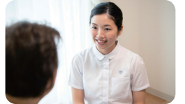
経験豊富な介護スタッフのケア