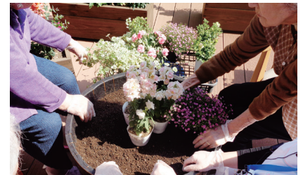
緑や花を通して認知症の 維持・改善を促す園芸療法