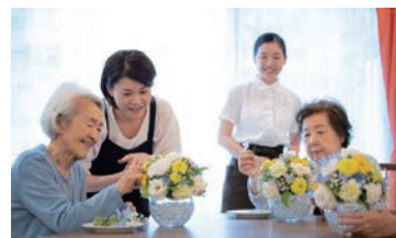
豊かな日々の暮らし