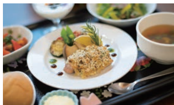
確かな味・彩り・食感