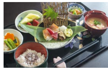
料理人が作る確かな味が好評です

ホスピタルメント文京千駄木では、嚥下機能の低下や経管栄養摂取をされている方に対しても、お食事の中で「食べる喜び」を感じて頂き、より豊かに日々をお過ごし頂くための取り組みを実施しております。同グループの桜十字病院でこれまでに実践された「口から食べる」のノウハウを共有し、管理栄養士・セラピスト・看護師など、多職種によるチームを立ち上げ、それぞれの専門的な立場からご入居者さまに向き合い、お口の中、覚醒の状態、食べる姿勢や体力、食べる意欲など、全身が「口から食べる」ことができるためのアプローチを行って参ります。