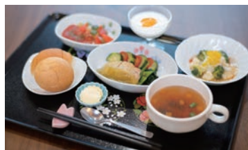
見た目を損なわず食べ易い軟菜食