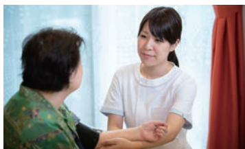
寄り添う看護・介護